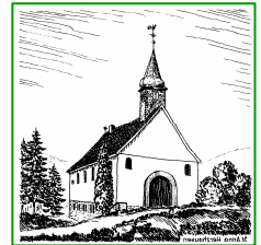
St. Anna Herzhausen